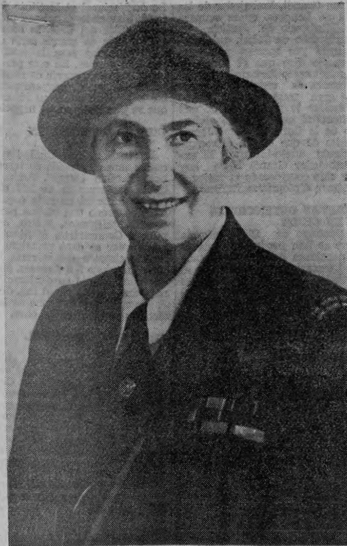
LADY BADEN POWELL

Hizo hoy su ingreso a Costa Rica la distinguida dama Lady Baden Powell, Jefa Mundial de las Muchachas Guías, quien permanecerá en el país hasta el 17 del corriente mes. El programa preparado para su visita es el siguiente: